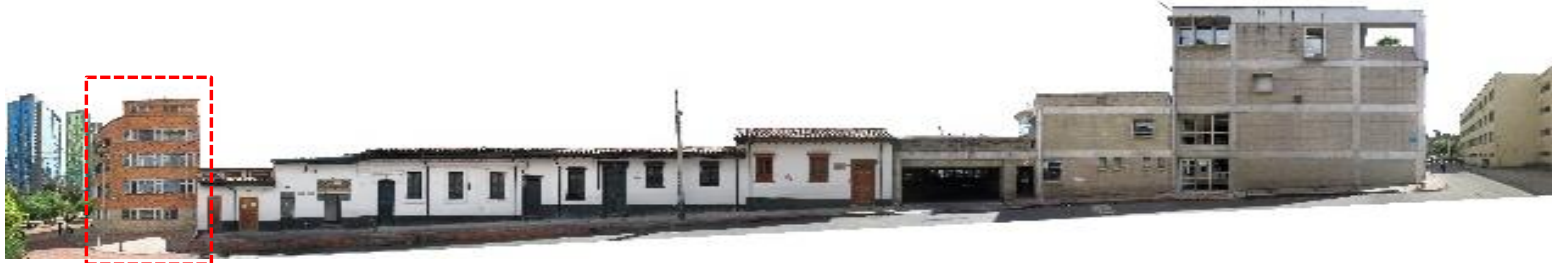
CALLE 19 BIS